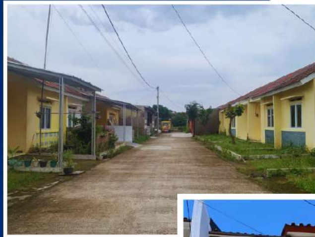
Pabuaran Residence- Subang